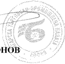
ЦВЕТАН СИМЕОНОВ Председател